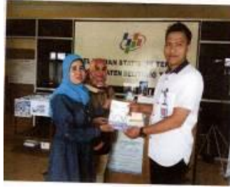
Foto Kegiatan Penyusunan Bibliografi Induk Daerah dan Katalog Induk Daerah

1.1.2 Kegiatan Pelestarian dan Pengelolaan Bahan Pustaka oleh Dinas Kearsipan dan Perpustakaan Provinsi Kepulauan Bangka Belitung dengan alokasi anggaran sebesar Rp. 9.650.000,00 realisasi anggaran sebesar Rp 5.359.000,00 atau 55,84%. Keluaran kegiatan adalah terkelolanya dan terpeliharanya bahan pustaka, sebanyak 430 bahan pustaka.