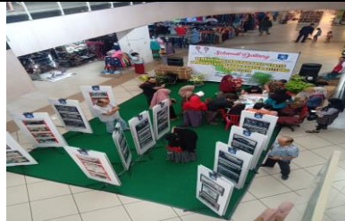
Foto Kegiatan Pameran Arsip Statis Pemerintah di Prov. Kep. Babel

3.2.2 Kegiatan Pameran Arsip Statis Pemerintah Provinsi Kepulauan Bangka Belitung oleh Dinas Kearsipan dan Perpustakaan Provinsi Kepulauan Bangka Belitung dengan alokasi anggaran sebesar Rp. 81.150.000,00 realisasi anggaran sebesar Rp. 74.499.500,00 atau 91,80%. Keluaran kegiatan ini adalah sebanyak 1.017 orang pengunjung pameran arsip statis.