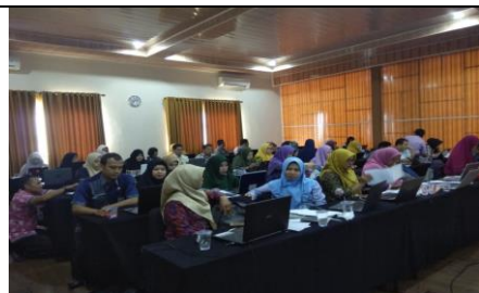
Foto Kegiatan Penerapan E-Arsip di Prov. Kep. Babel

1.1.1 Kegiatan Penerapan E-Arsip oleh Dinas Kearsipan dan Perpustakaan Provinsi Kepulauan Bangka Belitung dengan alokasi anggaran sebesar Rp. 111.042.000,00 realisasi anggaran sebesar Rp. 94.036.500,00 atau 84,69%. Keluaran kegiatan ini adalah OPD yang mengikuti bimtek e-arsip.