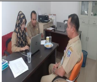
Foto Kegiatan Pengawasan Kearsipan Di Pemerintah Prov. Kep. Babel

3.1.3 Kegiatan Pengawasan Kearsipan di Pemerintah Provinsi Kepulauan Bangka Belitung oleh Dinas Kearsipan dan Perpustakaan Provinsi Kepulauan Bangka Belitung dengan alokasi anggaran sebesar Rp. 38.750.000,00 realisasi anggaran sebesar Rp. 1.213.900,00 atau 3,13%. Keluaran kegiatan adalah sebanyak 4 perangkat daerah yang mendapat pengawasan kearsipan.