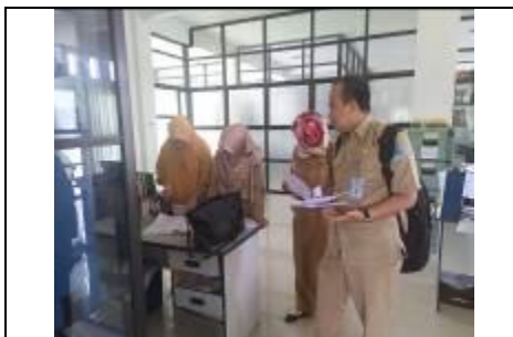
Foto Kegiatan Lomba Pengelolaan Kearsipan Desa/Kel, Perangkat Daerah, LKD Kab/Kota

3.1.1 Kegiatan Lomba Kearsipan oleh Dinas Kearsipan dan Perpustakaan Provinsi Kepulauan Bangka Belitung dengan alokasi anggaran sebesar Rp 84.819.000,00 realisasi anggaran sebesar Rp. 41.029.238,00 atau 48,37%. Keluaran kegiatan adalah terlaksananya lomba pengelolaan kearsipan, dengan jumlah peserta sebanyak 35 orang.