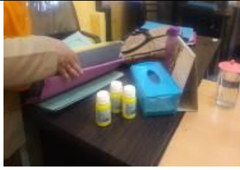
Foto Kegiatan Pemeliharaan Rutin/Berkala Arsip Daerah

3.2.2 Kegiatan Pameran Arsip Statis Pemerintah Provinsi Kepulauan Bangka Belitung oleh Dinas Kearsipan dan Perpustakaan Provinsi Kepulauan Bangka Belitung dengan alokasi anggaran sebesar Rp. 81.150.000,00 realisasi anggaran sebesar Rp. 74.499.500,00 atau 91,80%. Keluaran kegiatan ini adalah sebanyak 1.017 orang pengunjung pameran arsip statis.