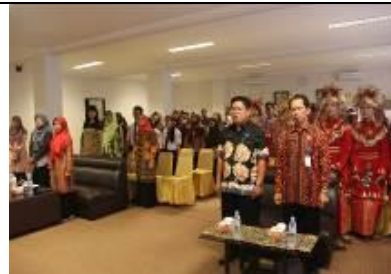
Foto Kegiatan Pengembangan Minat dan Budaya Baca

1.1.4 Kegiatan Pengembangan Minat dan Budaya Baca Pemerintah Provinsi Kepulauan Bangka Belitung oleh Dinas Kearsipan dan Perpustakaan Provinsi Kepulauan Bangka Belitung dengan alokasi anggaran sebesar Rp. 222.475.000,00 realisasi anggaran sebesar Rp 210.659.400,00 atau 94,69%. Keluaran dari kegiatan ini adalah terlaksananya lomba menulis puisi untuk anak SD, lomba bercerita bahasa daerah, lomba menulis anak untuk anak SMP dan SMA dan lomba penulisan cerita rakyat daerah, sebanyak 260 orang.