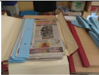
Foto Kegiatan Pelestarian dan Pengelolaan Bahan Pustaka

1.1.2 Kegiatan Pelestarian dan Pengelolaan Bahan Pustaka oleh Dinas Kearsipan dan Perpustakaan Provinsi Kepulauan Bangka Belitung dengan alokasi anggaran sebesar Rp. 9.650.000,00 realisasi anggaran sebesar Rp 5.359.000,00 atau 55,84%. Keluaran kegiatan adalah terkelolanya dan terpeliharanya bahan pustaka, sebanyak 430 bahan pustaka.