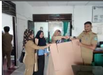
Foto Kegiatan Arsip Masuk Desa

3.1.2 Kegiatan Arsip Masuk Desa oleh Dinas Kearsipan dan Perpustakaan Provinsi Kepulauan Bangka Belitung dengan alokasi anggaran sebesar Rp. 17.130.000,00 realisasi anggaran sebesar Rp. 12.585.000,00 atau 73,47%. Keluaran kegiatan ini adalah sebanyak 25 desa/kelurahan yang mendapat layanan sadar arsip.